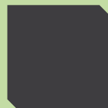
peinture d'apprêt : cataphorèse ou poudre