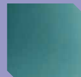
inox à la demande