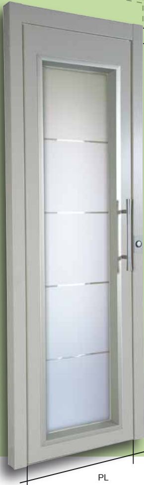
Linteau & montants ajustables à vos dimensions

Choix de finitions illimité, personnalisez vos portes selon vos envies.