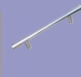
Poignées : bâton