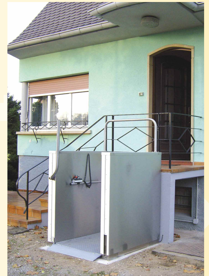
PLATE FORME HIRO 450

Possibilité d'installer un portillon verrouillé par une serrure électrique sur le palier haut (en option).